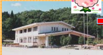
高原 4月24日 スタート