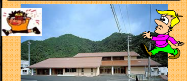
口羽 3月26日 ゴール