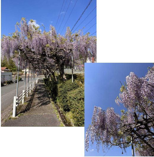
綺麗に咲いた藤棚

発行：高原公民館(〒696-0406 邑南町高見3014-3) TEL 0855-84-0521 IP 050-5207-5500