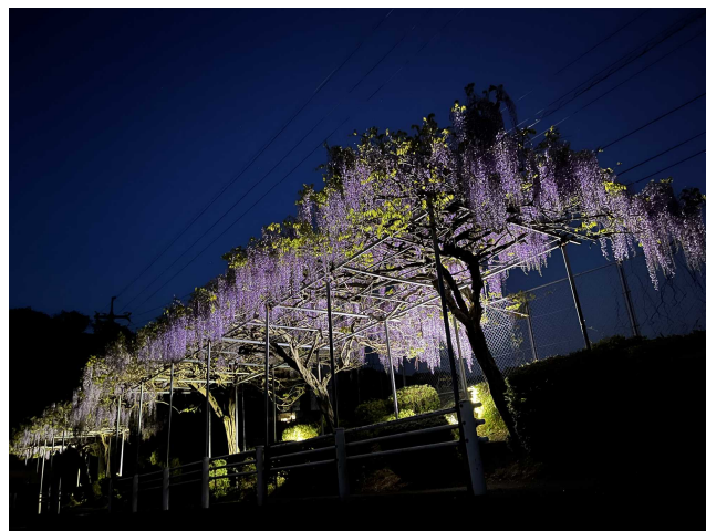
今年はライトアップも行いました★神秘的でキレイ…