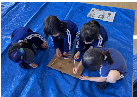
どこになんて書こう？ ねえねえ何色にする？