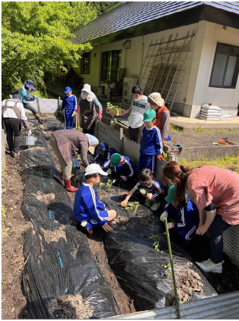
苗の植え付け方を聞きながら 一本一本丁寧に植えました♪