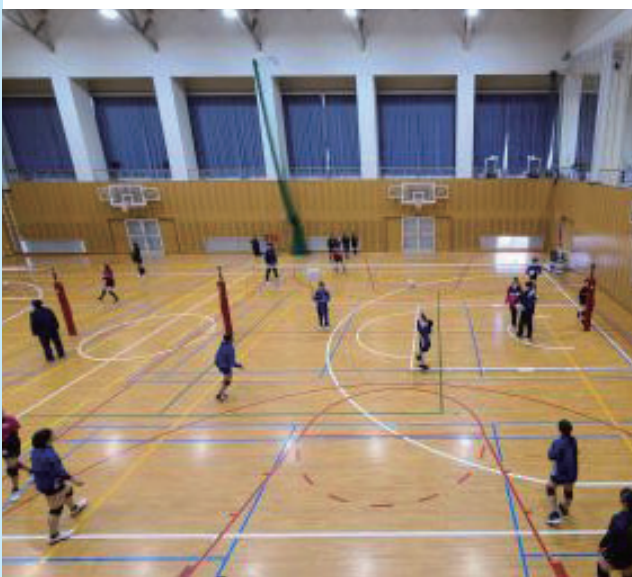
小中学校生と高校生がバレーの合同練習