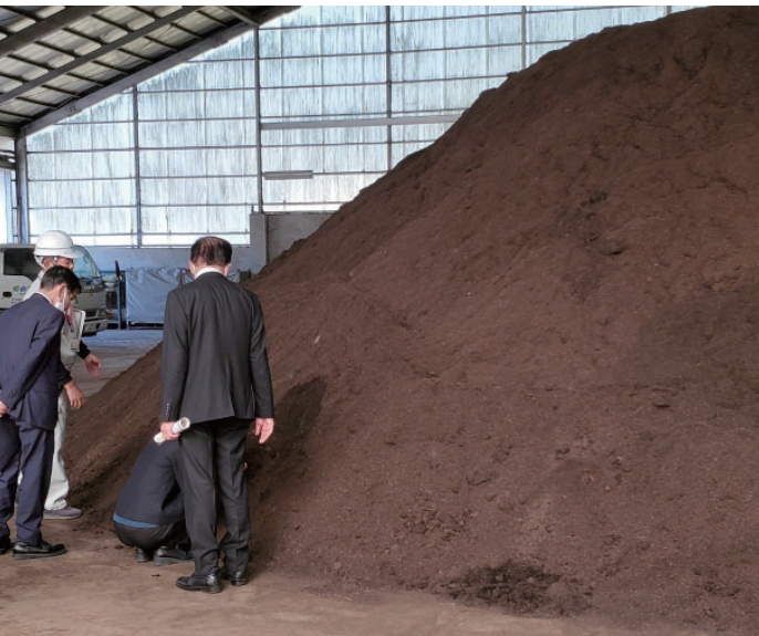
「美土里館」で製造された堆肥

400円で町民から買い取る落ち葉、農業者からは産廃となる粉殻などを原料として、環境保全や資源を生かした堆肥作りを進めています。高品質の堆肥は近隣で