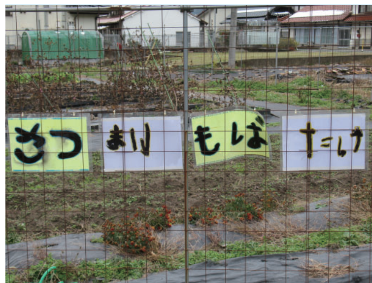
一校一菜に取り組む小学校の畑