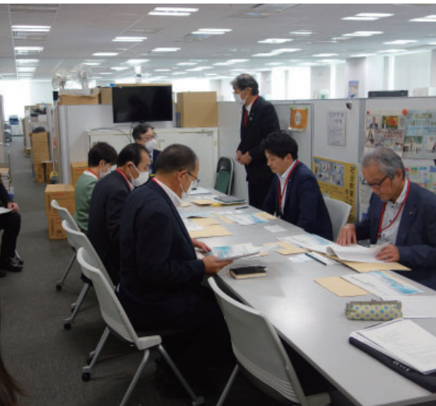
文部科学省 地域学校協働推進室で