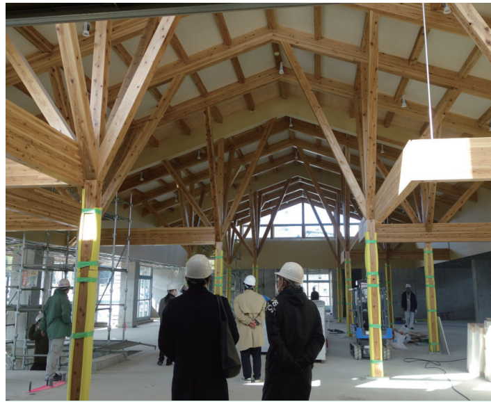
工事現場の視察を行った総務教民常任委員会

現在、3回目の入札に向けて、1790万円かけて設計の見直しをしているところだ。つまり全体としては予算内では収まるが、当初の見込みの甘さが露見したという事です。