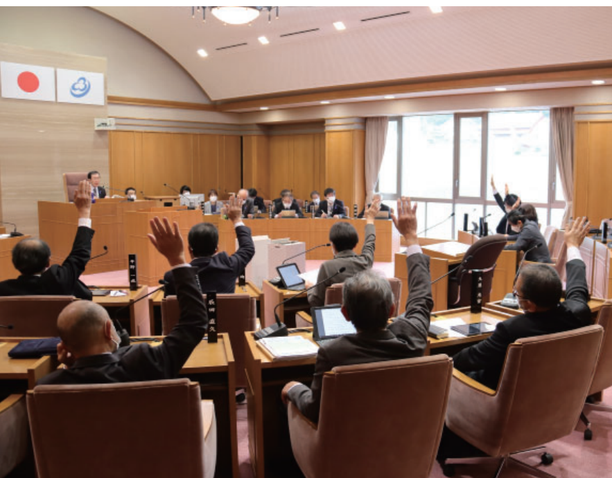
最終日に挙手で表決する議員