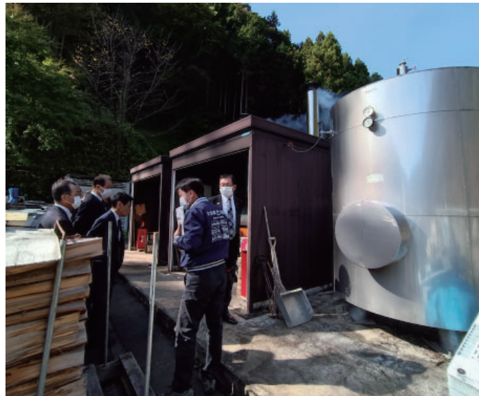
檜原村で薪ボイラーを見学し説明を受ける

販売される他、直営の「美土里農園」で活用され安心安全な作物となり、直営の「道の駅もてぎ」で販売され喜ばれています。