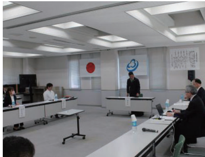
第1回目が開催された検証委員会のようす

委員会や全員協議会では、多くの質疑がありました。10%の削減率は甘いのではないかとこの質問に対し、最終的には40%をめざす必要があるが、まずは10%を目標に進めたいとの答弁がありました。また、施設削減率低迷の理由を質したり、用途別の管理計画の提案や、土地の譲渡、売却の提案もありました。今後、住民向けの説明会の開催が計画されており、住民の合意を前提として進めていただきたいと思っています。