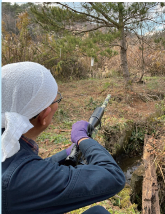
鹿にかかった鹿を狙う猟師さん