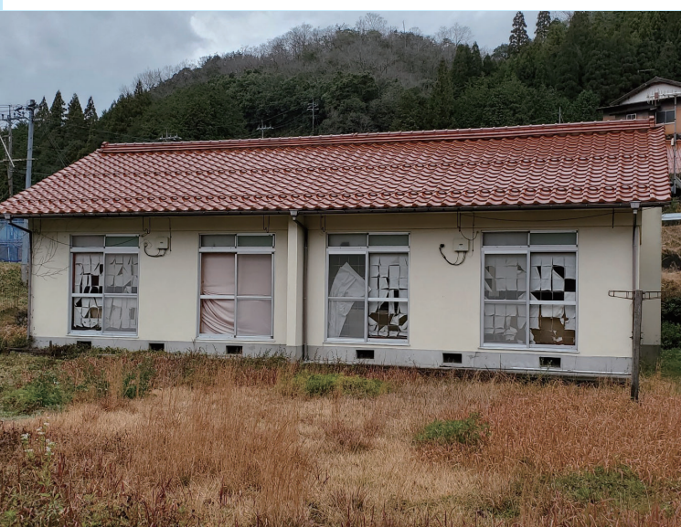
使用不可能な教職員住宅

今後の農業は、個人の形態が継続されなければならぬ。新規就農者も頑張っているのに、全体的に農業への関心を高め、農業振興に取組みたい。特に人材育成は重要と考える。