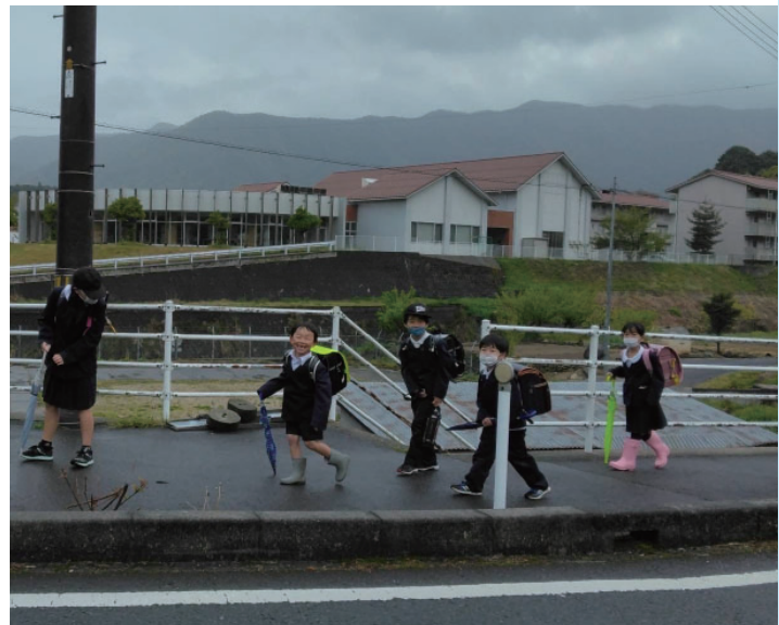
安全な通学路を通学する子どもたち