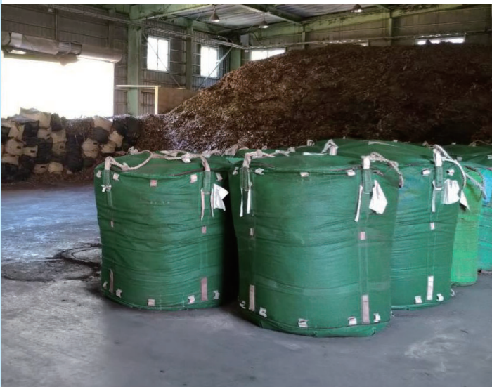
茂木町「美土里館」の堆肥の原材料 奥に町民が集めた落ち葉が見える

行地域づくり事業」と「脱炭素重点加速化事業」を複合的に組み合わせた取り組みに対して支援を行なおうとしている。事業計画の概要、この事業が必要である理由について問う。