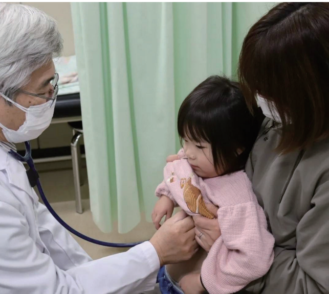
子どもたちが安心して医療を受けられる事業です

子ども条例 第15条2項：町は、子どもの健全な成長を支援するため、その健康の確保及び増進に関する施策等の充実を図る。