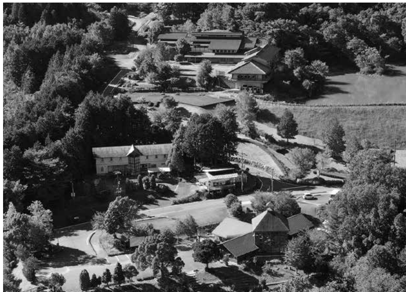
香木の森公園と霧の湯