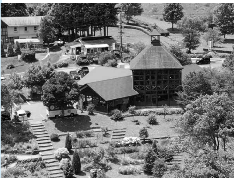
耕すシェフの研修先となっているレストラン香夢里

A級グルメも子育て日本一構想も、始めてから年月が経っている。一旦立ち止まり考える必要があると思う。