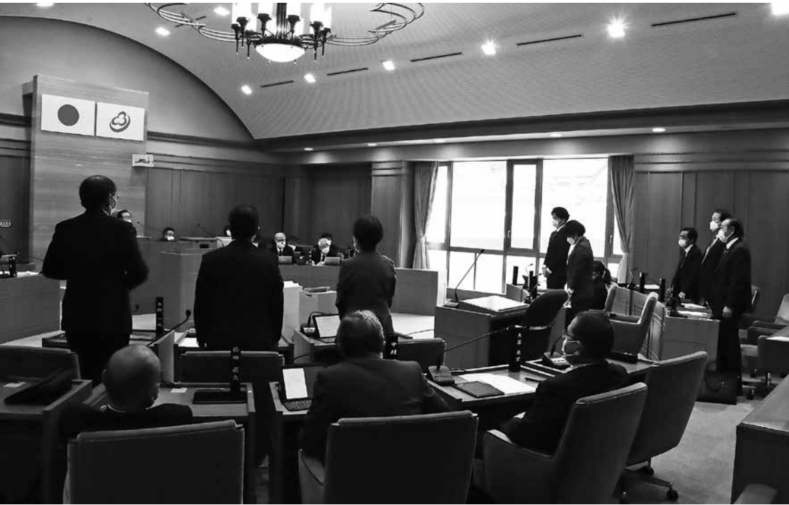
一般会計補正予算第10号に起立で賛成する議員

12月定例会を12月5日から14日までの会期で開催しました。町長提出議案23議案のうち4議案で反対討論が行われましたが、すべてを原案通り可決しました。全員協議会の協議事項は13件と多く(11〜13ページ参照)、議論の内容の濃い議会でした。その他、受理した請願1件と継続審議としていた陳情1件を採択しました。