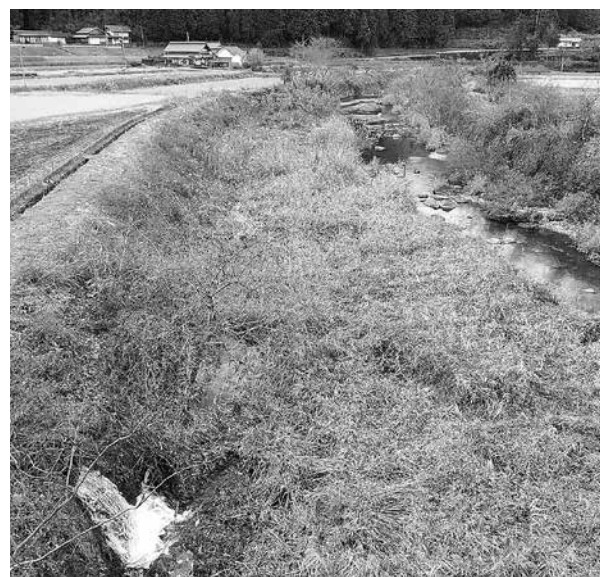
土砂が堆積し、雑草が繁茂した河川

町道については、倒木処理等を建設業者、維持作業員に委託しており、関係の事業費を予算計上