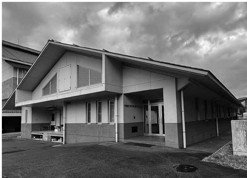
東学校給食センター