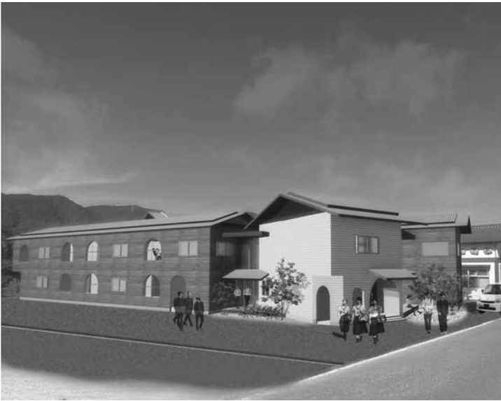
新館別棟の完成予想図