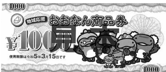
配布の始まっている商品券

この時は、令和5年2月1日までに出生または転入した方を交付対象者としていましたが、委員会や全員協議会で協議し、令和5年3月末までの出生者及び転入者にも交付すべきではないかとの意見がありました。 その後、執行部で検討され、12月定例会で対象者を令和5年3月1日から3月31日において、住民基本台帳に、新たに登録された方に拡大するための補正予算が提出され、可決しました。 この財源は、8月臨時会で決定したコロナウイルスの影響による減収事業者への支援金事業の内、不要となった金額を含む臨時交付金1億500万6000円と、12月追加分として一般財源122万9000円を充てています。