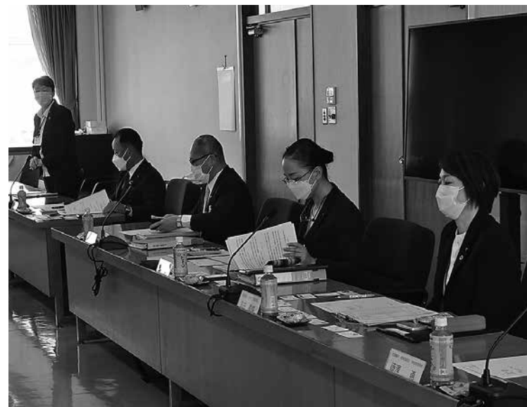
女性管理職が多い南箕輪村

出迎えてくれた課長、議会事務局長が女性で、管理職も6割が女性だということ、働く女性支援もリアル感があり、結果も出ている村です。そして、住民の口コミで移住