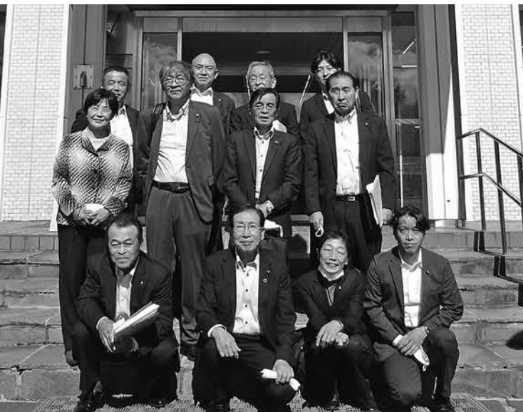
原村役場まえでの集合写真