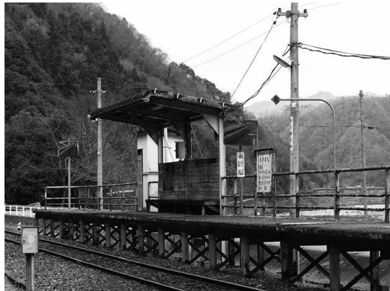
地元で管理されてきた作木口駅

この発言があり、来年度の施策と予算への関わり、事業者の役割については、行政からの支援はあるのか、文中の文言の解釈などの質問がありました。また、町民に条例の理念をわかりやすく伝える必要性についての要望もありました。 子ども条例は、子育て・子育ての環境作りに「地域総がかり」で取り組むための基本理念です。子ども施策にどのような生かされていくのかが期待しています。