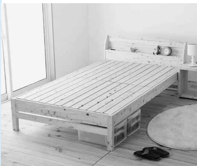
ふるさと納税で人気のヒノキベッド

産直市企業組合の方で、今春から新たに専門職員を雇用され、出荷者の取りまとめや出荷品がより集まる仕組みも進めている。しっかりと開業に繋げていきたい。