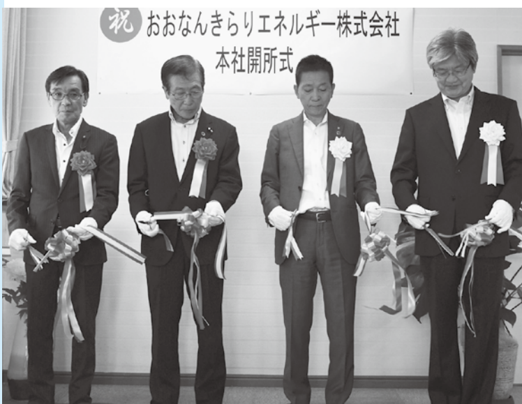
開所式のテープカット

ているのは、再整備を進めている道の駅瑞穂での地中熱を活用した融雪設備・空調設備の導入、豊富な森林資源を活用したバイオマス熱利用など考えている。