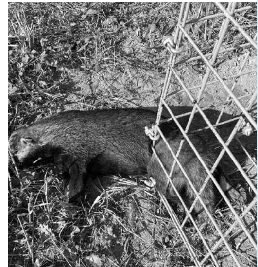
オリから逃げようとするアナグマ

止計画にあるように、町内から一掃することを最終目標とするのなら、特定外来生物捕獲講習を受けた方にも報奨金を出すことはできないか。