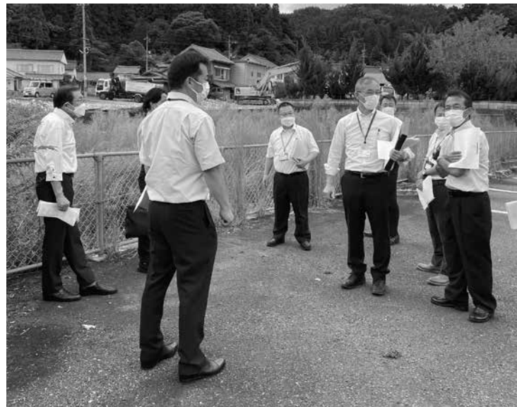
現場で担当課からの説明を聞く

産業建設常任委員会のメンバーで、道の駅瑞穂再整備計画の予定地の視察に行きました。 現在の道の駅より左側の国道261号線沿いに計画されており、建物の取り壊しが進んでいます。現地立つと、図面で見るとより広く感じ、完成後の姿を想像すると、ここに道の駅が建つかと感慨深くもありました。 全敷地が町有地であることが再整備の条件だと聞いていましたが、建設課からは、色々検討し