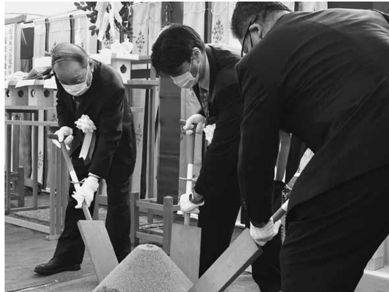
石見中学校改築工事の起工式