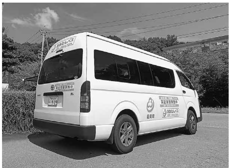
邑南町役場に停車中のおおなんバス実証実験便

邑南町役場地域みらい課 TEL：0855-95-1117 I P：050-5207-3019