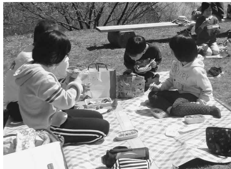
放課後児童クラブを活用する児童

す。広く町民の意見を聞くために、無作為抽出の住民会議を開催し、中高生ともワークショップを開くなどしてきました。その後さらにパブリックコメントなど踏まえ、最終原案を策定し8月17日開催の日本一の子育て村推進本部にて提案したところ、もう少し練り直しが必要となりました。当初、