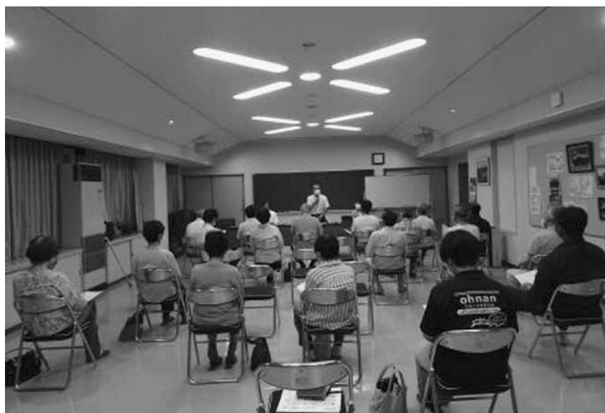
たくさんのご参加をいただいた日貫公民館