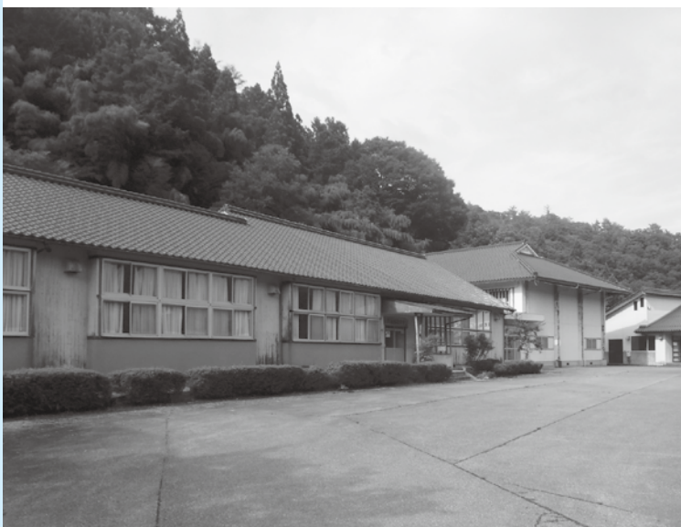
早期の活用再開が待たれる久喜林間学舎

道の駅の機能として、休憩機能・情報発信・地域連携の機能がある。どう整理するかは建物内のスペースや提供内容を検討する必要がある。行政や地域の団体などと連携して情報収集、スタッフの知識取得等が必要となる。