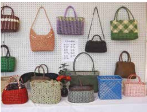
阿須那公民館まつりで展示された作品