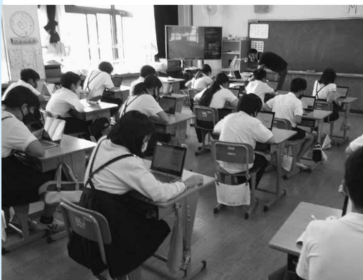
タブレットを活用する児童生徒

柳川情報みらい創造課長 リスクがないわけではない。また、職員もIT任せではなく制度等の熟知は当然必要である。