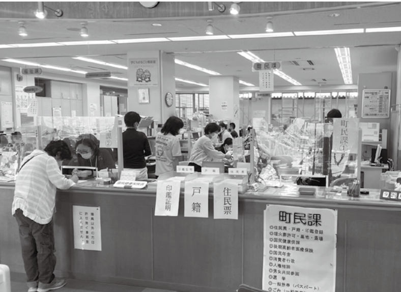
窓口の開設時間は変わりません

以上のような成果と課題を踏まえ、議会では引き続き改善に取り組むよう要求しました。 申請が必要な項目については、申請期間が終了した事業もあります。