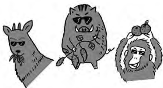
ふるさと寄附を活用し鳥獣被害対策を強化