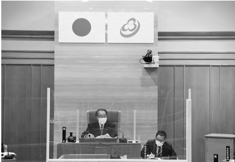
本定例会から議場に国旗及び町旗を掲揚