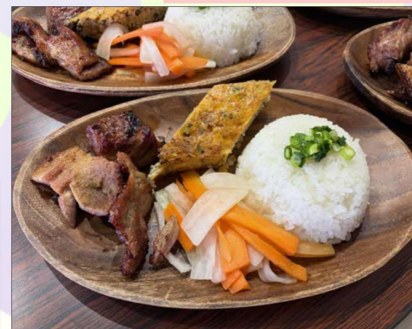
←クッキングシートを敷くのは任せてよ!