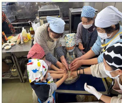
←「コムタム」の主な材料は砕けたお米なのでみんなでこすります!!

参加者の方からは、「楽しくベトナムの事を知れた」「また参加したい」など感想をいただきました。