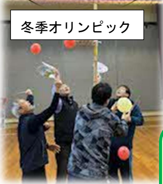
冬季オリンピック