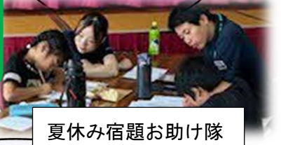
夏休み宿題お助け隊