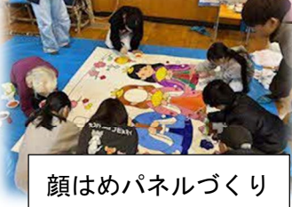
顔はめパネルづくり