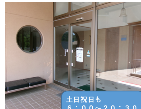
土日祝日も 6：00～20：30 開きます。