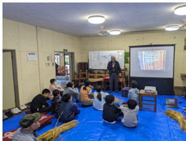
↓R7年開催の口羽っ子会宿の様子

みなさん、コミュニティスクール（CSと表記されたり、コミスクと略されたりもします。）をご存じですか。コミスクとは学校運営協議会を設置している学校のことです。学校運営のメンバーに教職員、保護者だけでなく、地域住民も参加していただき、「地域とともにある学校」をつくっていきます。令和8年度から邑南町でスタートしています。活動内容をお知らせしていきますのでよろしくお願ひします。