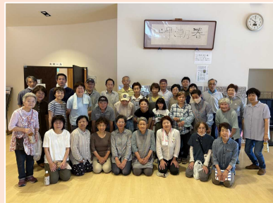
昨年度の様子です。