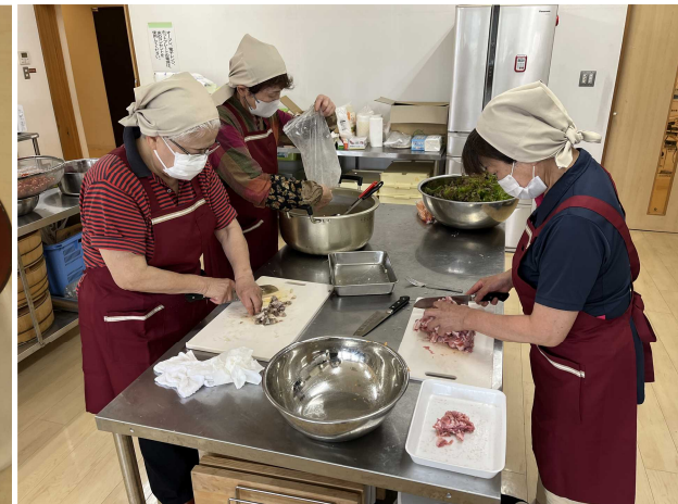
※写真は過去の写真です。

キッチンはんざけが主催するみんなの食堂(以下食堂)は昨年6月から開始し、いよいよ1年が経とうとしています。