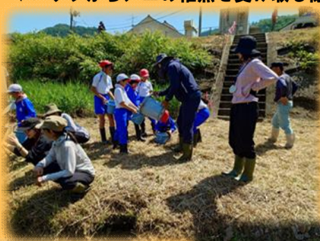
▶見守る子どもたち