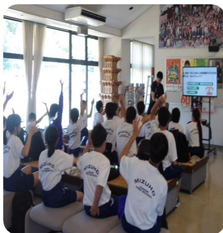
↑写真から伝わりにくいかもですが・・・主事緊張してます・・・少々・・・

5月29日（金）に瑞穂中学校の1年生が校外学習で1日かけて布施、高原、出羽、田所の各公民館を歩いて訪問されました。 お昼過ぎに出羽公民館にも来られて、主事から出羽地域のお祭りやイベントや久喜銀山、瑞穂中学校と出羽公民館との関わりなどをクイズ形式などでお話をさせていただきました。 クイズに答えながら出羽地区の事を学ばれていました。 長い道のりだったと思いますが、友達と励まし合いながら協力して歩き切ることが出来たそうです！ これからも協力しながら、楽しい中学校生活を送っていただきたいと思いました。 また瑞穂地域のイベントや行事に参加したり、出羽公民館へ気楽に来て頂けると嬉しいです！