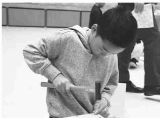
地元の大工に教わって釘を打つ参加児童