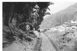
大雪による倒木被害