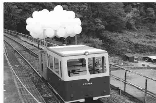
鉄道資産を活用したトロッコ列車

11月22日と23日に、宇都井駅周辺で「INAKAイルミ2019@おおなん」が開催されました。今年で10回目を迎えるINAKAイルミでは、初の試みとしてJR西日本から譲り受けた鉄道資産を使ってトロッコ列車を走らせました。トンネル内にもイルミネーションを飾り、乗る人を楽しませていました。