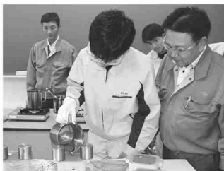
鑄型に溶かした金属を流し込む生徒