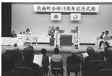
SORAIRO(ソライロ)による「さくらほろほろ」合唱

第2部では、町内外で活躍しているコーラスグループ(SORAIRO(ソライロ))による町のイメージソング「さくらほろほろ」の合唱があり、邑南町15年のあゆみが紹介されました。