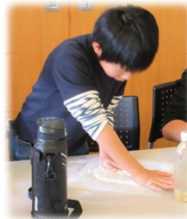
▲生地をしっかり伸ばしていきます