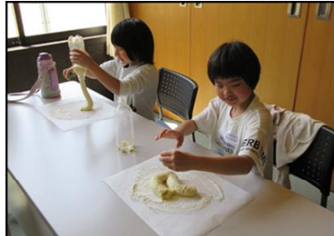
▲生地が勢いよく出てきてびっくり！