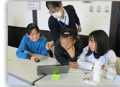
▲パソコンでデザインをしています

表面から引き続き、「あすなキッズカルチャー」で行った「缶バッヂづくり」の様子です。※邑南町学校ICT支援員の方に教えていただきながらデザインしました。