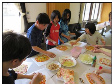
▲自分の好きな具材をトッピング！