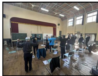
体操やストレッチも教えていただきました