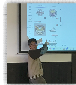
▲使い方を教えていただきました