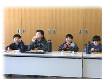
▲「美味しい」とみんなたくさん食べました