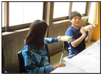
▲ペットボトルを振って生地づくり