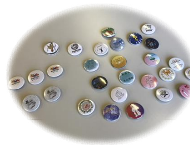
▲素敵な缶バッヂができあがりました！