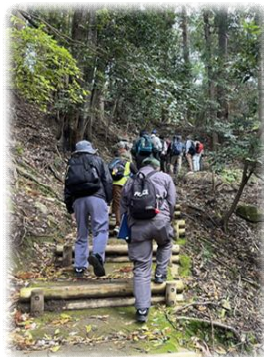
▲本丸を目指して登りました!