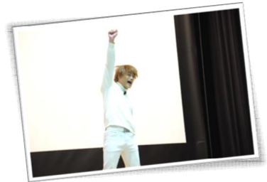
▲おばたのお兄さんの ▼ ポジティブエクササイズ

当日は約200名の来場があり、多くの方に様々な体験をしていただき社会教育に触れ、体験していただく機会になったと思います。