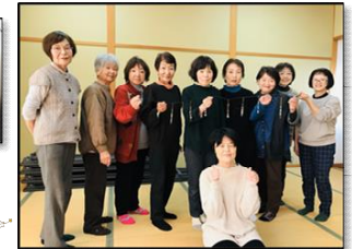
▲ステキな作品が出来ました!

完成したあとは、作品のお披露目会をしました。 バッグやスマホに付けたり、フックを外してセーターに合わせるのもいいね、と話に花が咲きました。