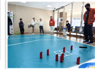
▲モルック・ポッチャ カラーリング体験