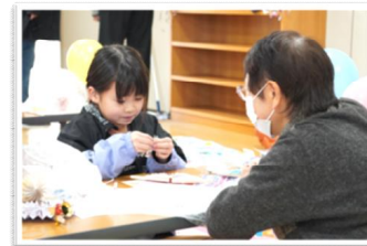
▲子どもと地域のほっこり工作会