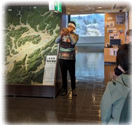
▲安芸高田歴史民俗資料館を見学・記念写真

R7.12.17発行 阿須那公民館 TEL:0855-88-0001 FAX:0855-88-0002 IP:050-5207-6000