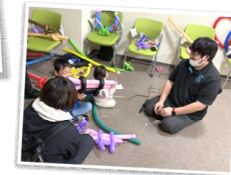
▲主事といっしょ ～バルーンアート編～