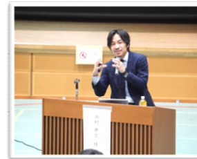
▲田村氏による講演会