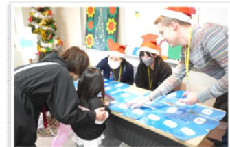
▲ちょこっと世界旅行