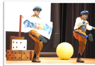
▲「おんぷらんと」による パフォーマンス