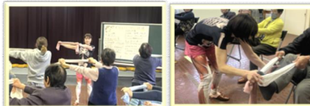
▲椅子ヨガ教室 タオルを使つてのストレッチ