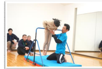
▲親子運動 ▼水消火器体験