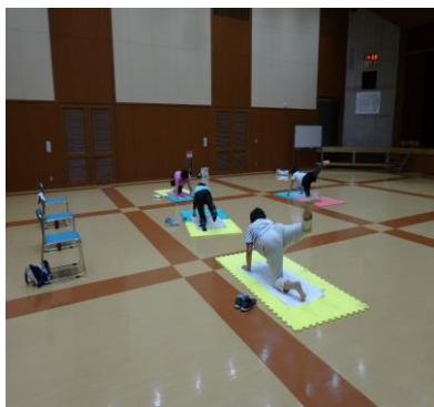
有酸素運動でスリムアップ！