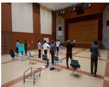
レッツエクササイズ!