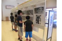
過去のパネル展の様子

主事のひとごと...「ハンザケ」 とある日、事務室で仕事をしていると「ハンザケがおるけど、どおすりやあええ?」と住民さんが来られました。慌てて見に行くと、80cm位のハンザケが公民館前の水路をのそのそと歩いていました。初めて野生のハンザケをみて感激しました。子どもにも見せてやりたかった~。担当者に来てもらい川に戻してもらいました。ハンザケは無許可でかまうことも禁止されているようなので見かけた場合は見守ってあげてください。