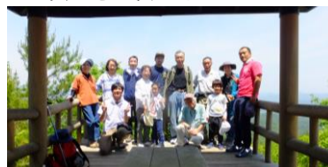
頂上の東屋での集合写真