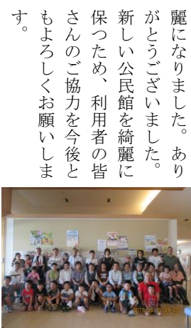
たくさんの参加者