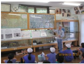
林間学舎での説明

皆さんは「銀山」と聞くと、何を連想しますか。おそらく、石見銀山と思いきや、邑南町にも、いかと思えます。邑南町にも、石見銀山と並ぶぐらいの価値がある銀山があります。こんな身近に、誰にでも自慢できる素晴らしいお宝があるということを知り、この町を誇りに思ってもらいたいということを目的として、学校と協力し授業の一環として学習しています。