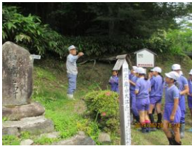
銀吹山品龍寺横のからみ原