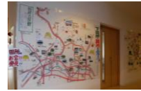
大ホール横通路に展示中

田所地区の各自治会ごとのお宝マップを掲載しております。これは、公民館地域づくり部・環境部で5年かけて作り上げたものです。