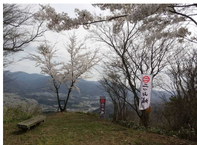
西の丸からの眺望、桜が綺麗でした

しかしながら、本城の方には昨年の秋に登って以降、行けないので近いうちに現状確認に行ってみたいと思います。