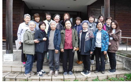
ふれあい公園交流館前で記念撮影

しかし、あいにくの花冷えの日となり、お弁当を食べ終わると寒さが身にこたえそうだったため予定より早く終了することとなりました。ご参加いただき、ありがとうございました。