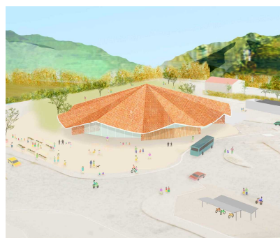
新しい道の駅の完成予想図