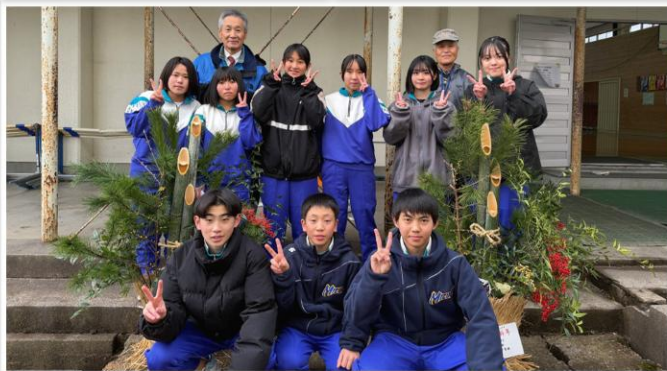
布施公民館の門松を作成したの生徒のみなさん