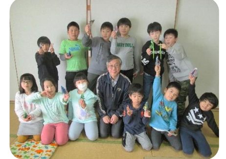
12月13日 公民館へレッツゴー