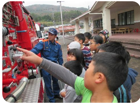
11月18日 主事とレッツゴー 防災・災害について学ぼう！

12月13日（金）には市木のおはなし会よむよむや講師の方々と一緒に、ポッチャを通じた共生社会についての学習や鍋パーティー、ポップアップカード作りを行いました。