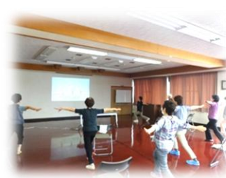
1回目は10名の参加がありました。

井原運動教室を7月3日より再開いたしました。コロナ禍の影響によるストレス、運動不足等を解消しましょう。運動教室は毎週金曜日の午前10:00より開催しておりますので、お気軽にご参加ください。最終金曜日はノルディックウォーキングを行います。※初めての方でも大丈夫です。