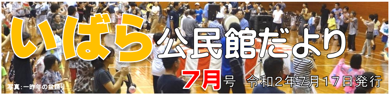
写真：一昨年の盆踊り