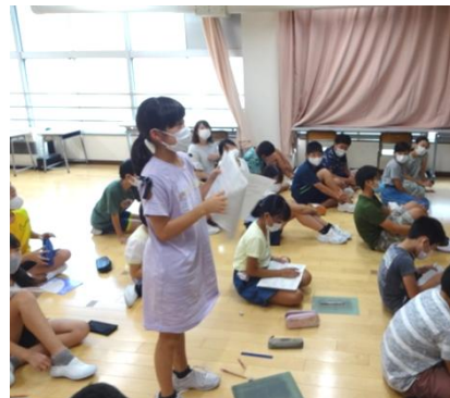
毎回関心させられますが、質問の時にはほとんどの児童が手をあげ質問をします。