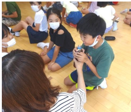
肥料の臭いにびっくり。