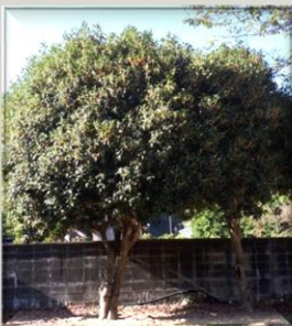
旧山崎家住宅の入り口 にある2本のキンモクセイが満開でいいにおい がしていました。