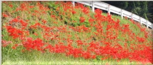
今年も彼岸花が真っ赤に染まっていました。 毎年、お手入れに感謝です。