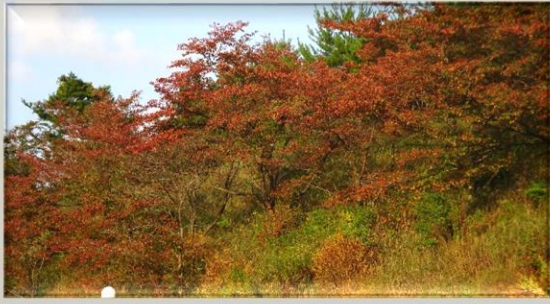
体育館横の紅葉した桜の木