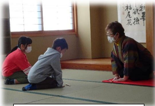
和室の畳を表替え修繕し、畳のにおいが する中でのお茶会。