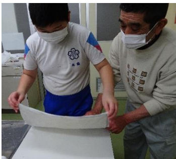
漉いた和紙を台の上に置き、水分を拭って乾かします。