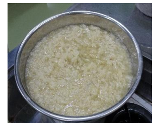
繊維が細かくなったら、漂白をします。