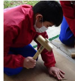
木槌で木の繊維を細かくします。