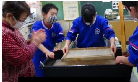
木枠を入れて紙漉きします。