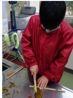
木べらで外皮を取り除きます。