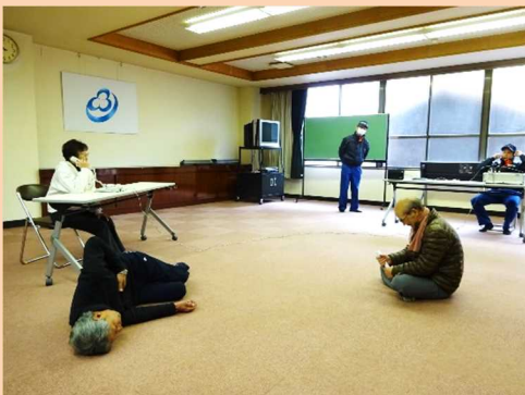
電話機を使っでの通報訓練