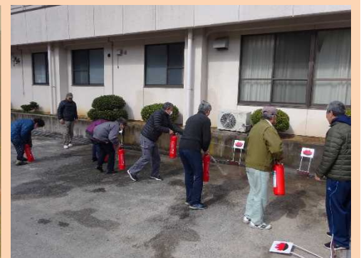
水消火器を使っでの消火訓練