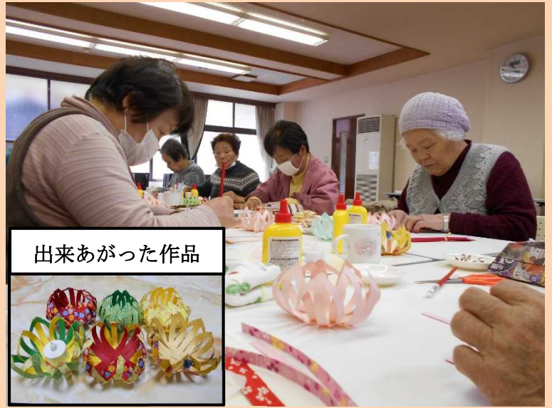
出来あがった作品

教室では年間を通してたくさんの方に参加していただきありがとうございました。来年度も引き続き手芸教室を開催する予定です。ぜひご参加ください。