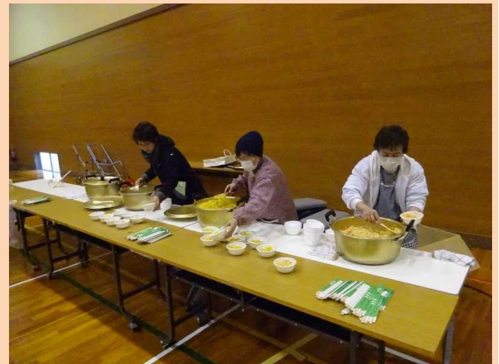
非常食の試食をされました