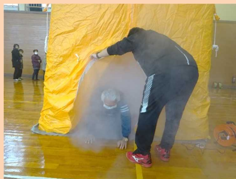
煙体験装置を使っでの避難訓練