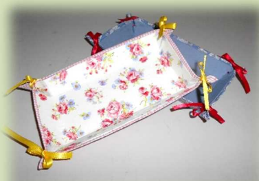
牛乳パックで作るトレイ