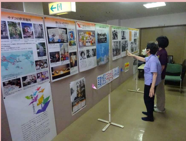
展示されたパネルと見学者の皆さま