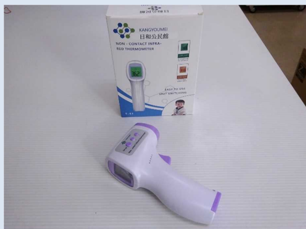
ご寄付いただいた非接触型体温計(うち1個)