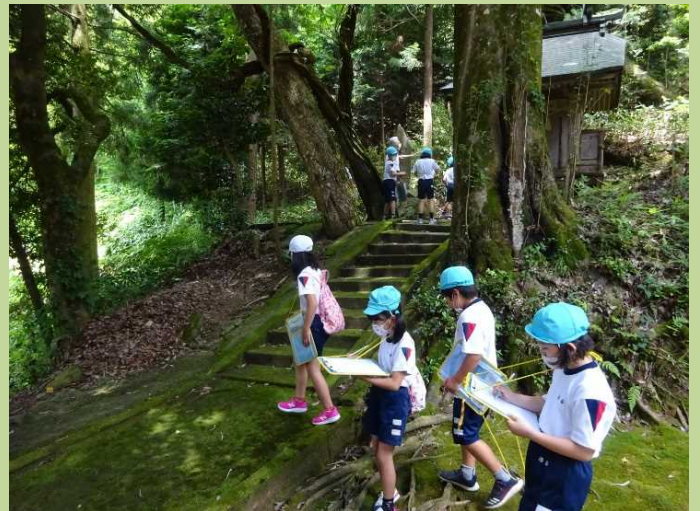
桜井神社の境内を歩いて回りました