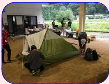
ワーク①まずはテント立て

邑南町公民館連絡協議会主催のリーダー研修を8月22日に口羽地区にあるわんぱく館で開催。今年の開催テーマは「自ら考え、協力して行動する」です。町内の4～6年生19人が参加しました。