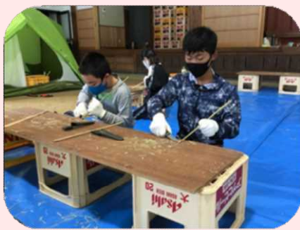
ワーク②ナイフで竹串作り