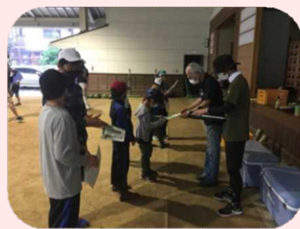
修了証をもらいました