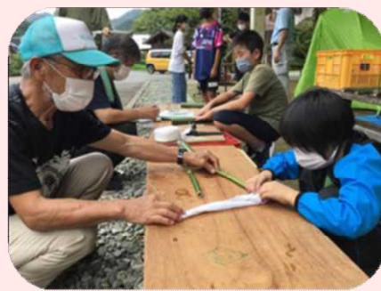
ワーク③水鉄砲作り