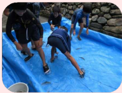
ワーク④アユのつかみ取り