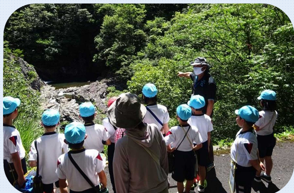
6/29 日和探検 千丈溪探索にて

ふるさとを学び、愛着を持っていただくとともに、地域の魅力や特性を知ってもらおうと、地域や矢上小学校と連携したふるさと学習を昨年に続き2週連続で開催。矢上小3年生児童を対象に日和地区内を巡る「日和地区探検」を6月29日(水)、日和地内で生きる「ハンザケ観察」を7月8日(金)に行いました。実施に際し地区内外の多くの方に案内や説明をお引き受けいただき、ありがとうございました。