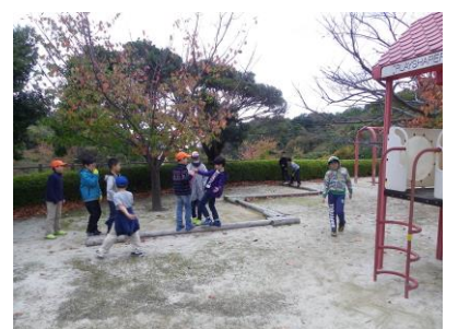
半袖Tシャツで遊ぶ元気な子もいました