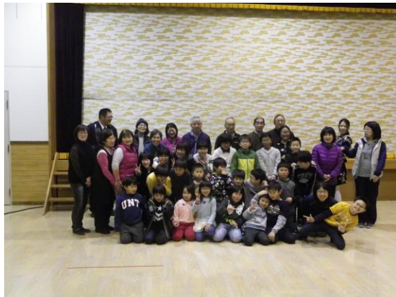
全員で記念撮影をした後、児童たちが考えたゲームをして楽しい一時を過ごしました！