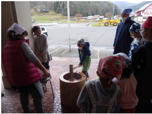
みんなで「よいしょ」と大きなかけ声をかけながら餅つきをしました。

この事業は二学級のみなさんが企画され、司会進行も含め全て児童たちで行われました。将来の良き隣人となる小学生の頼もしい姿を見ることができました。