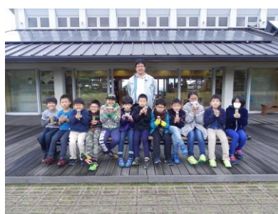
完成品を持って記念撮影

島根県産の材料を使った工作体験や、自然の中での遊びをとおして、ふるさとの良き思い出となってくれたらと思います。