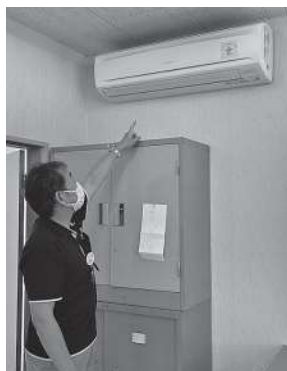
購入したエアコンと椅子 (日和中央自治会館)

コミュニティの維持に必要な備品を整備することで、地域づくりにつながる活動を継続するため、一般財団法人自治総合センターの「一般コミュニティ助成事業」を活用し、このほど日和中央自治会館にエアコン3台と椅子30脚、台車2台を購入しました。今後、健康に配慮した環境下で、様々な会議や行事などを行うことができるようになりました。